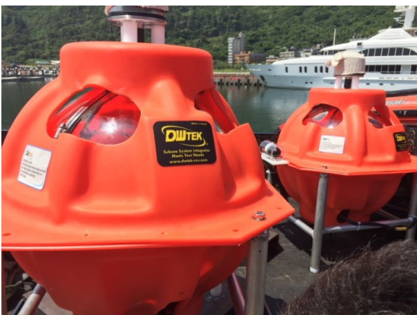
海底地震儀系統測試